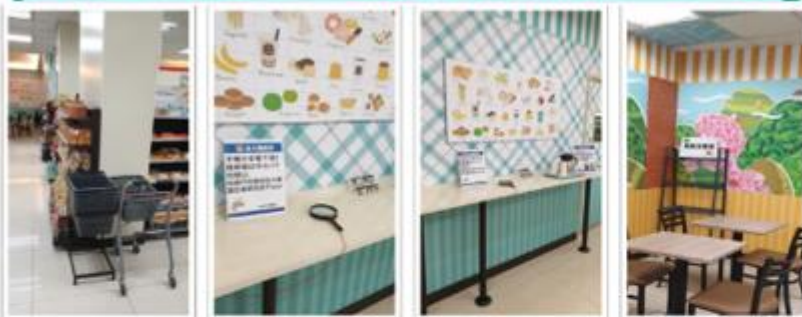
輔佐類：購物推車、老花眼鏡與放大鏡、菜籃區