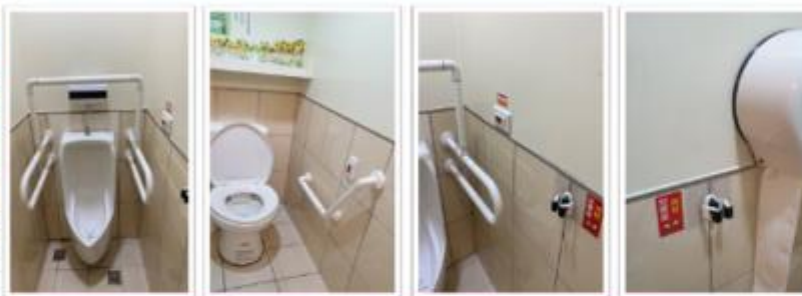
設施類：廁所安全扶手+求救鈴+拐杖放置區