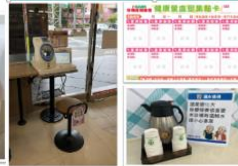
設施類：千禧智慧健康小站、溫水壺