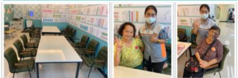
設施類：扶手椅與矮桌